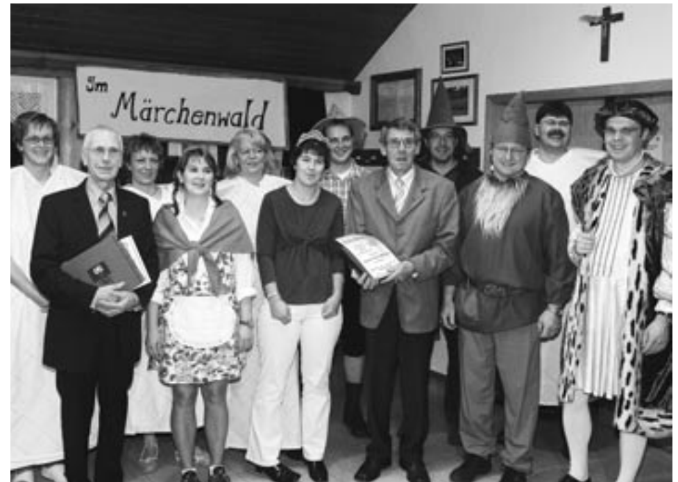
Viele verdiente Mitglieder wurden für langjährige aktive Mitgliedschaft geehrt.