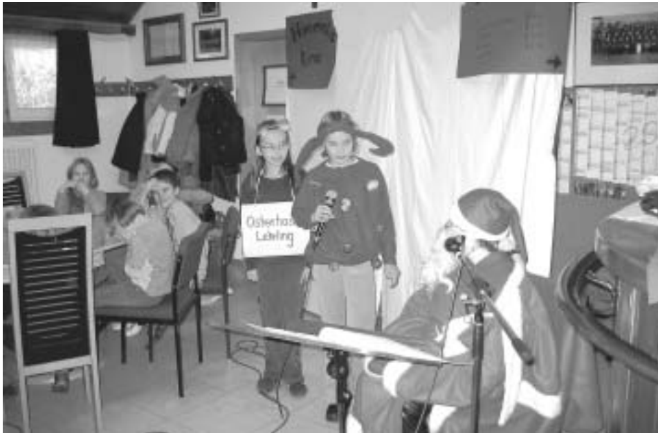
Auch dieses Jahr überraschte der Nikolaus die Kinder mit kleinen Präsenten.

Am 04.12.2004 fand die diesjährige Nikolausfeier der Lyra Höfen statt. Da der Nikolaus seinen Besuch angekündigt hatte, trafen sich alle Kinder, die ein Instrument lernen und deren Eltern, sowie die Kinder der Aktiven im Proberaum. Zuerst spielte die Blockflötengruppe und mehrere Kinder hatten das Theaterstück „Der verliebte Nikolaus“ eingeprobt, welches sie dem Publikum vorführten. Auch die Querflöten und die Klarinetten stellten ihr Können unter Beweis. Die Blockflötengruppe hatte sich für ihren Auftritt etwas Neues überlegt und erzählte die Geschichte von „Rudolf“ und spielte dazu ein paar Stücke. Und dann war es endlich soweit, der Nikolaus kam und brachte jedem Kind eine kleine Überraschung mit. So war es für alle ein schöner Nachmittag, der viel Spaß gemacht hat.