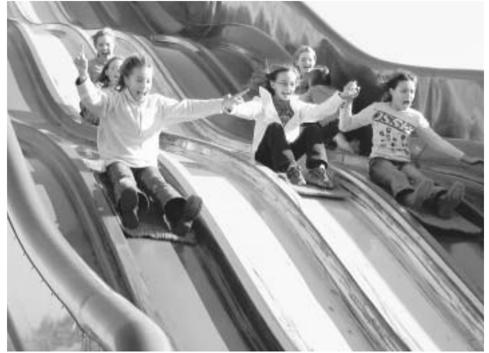
Sichtlich vergnügt machten die Mädchen ein Wettrennen auf der Riesenrutschbahn im Bubenheimer Spieleland.

Nach dieser sehr kurzen Nacht freuten sich alle am nächsten Morgen auf das leckere Frühstück und im späten Vormittag ging es dann mit dem Bus in Richtung „Bubenheimer-Spieleland“. Nachdem alle Gruppen mehr oder weniger erfolgreich durch das Maislabyrinth gelaufen waren, konnten sich die Kinder auf dem