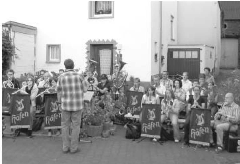
Die Lyra Höfen beim Platzkonzert auf dem Straßenweinfest "Lössnicher Herbst".

und konnte schon einmal die ersten Schlücke Wein genießen. Der Nachmittag stand zur freien Verfügung in Bernkastel. Manche zog es direkt in die nächsten Weinkeller, andere bevorzugten einen Bummel durch die Altstadt von Bernkastel, die mit ihren Sehenswürdigkeiten einlud. Um ca. 17 Uhr traf man sich wieder an der Schiffsanlegestelle, um von dort aus mit dem Schiff weiter zu fahren. Obwohl die Schifffahrt deutlich länger als geplant dauerte, tat dies der Stimmung keinen Abbruch. Man hatte die Zeit unterschätzt, die ein Schiff benötigt, um eine Schleuse zu passieren.