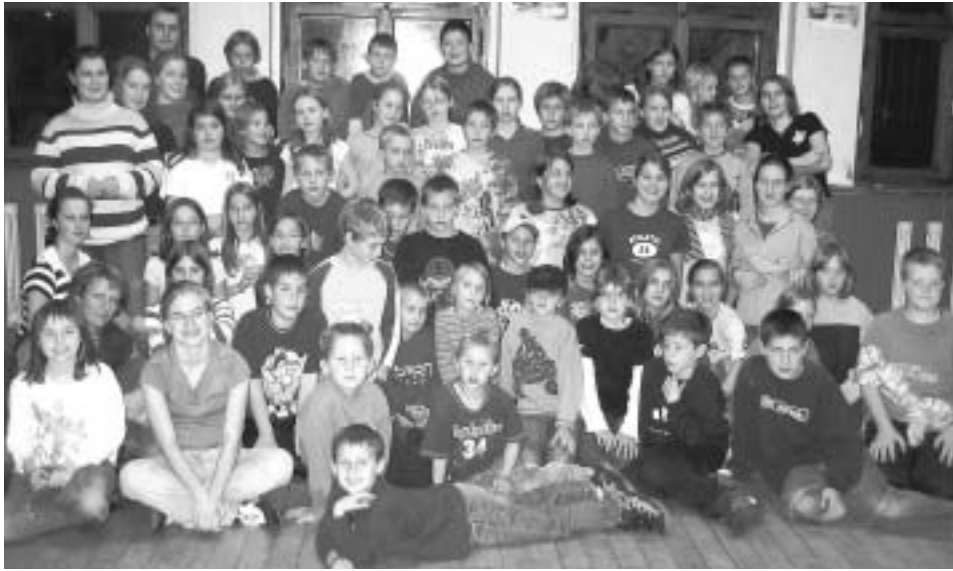
Gruppenfoto mit Kinder und Betreuer beim diesjährigen Ferienlager im Pfarrzentrum Höfen.

In diesem Jahr stand das Ferienlager unter dem Motto: „Auf geht's in die Welt des Films“