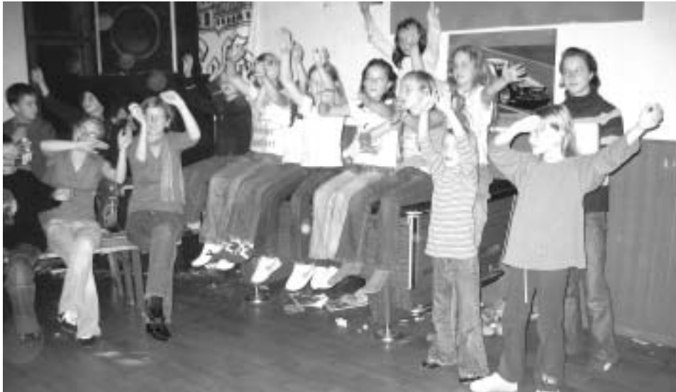
Begeisterte Fans bei der Show "Lyra Höfen sucht den Superstar" am Freitag Abend in der Disco.