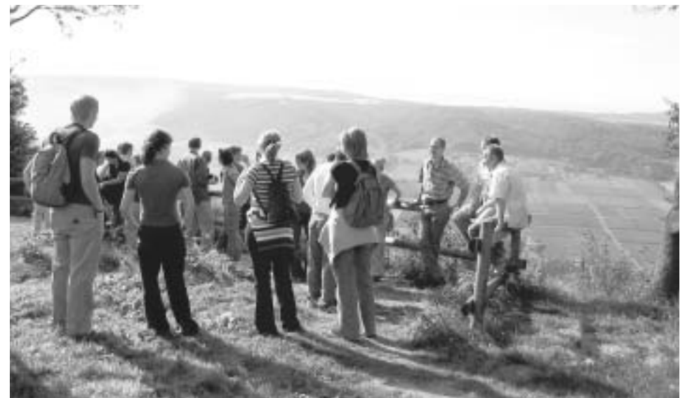
Bei der Wanderung durch die Weinberge von Lössnich hatten die Lyraner einen tollen Blick auf das Moseltal.

direkt ein zweites Mal als Zugabe gespielt werden. Nachdem nun das Platzkonzert der Lyra beendet war, zogen alle in kleinen Gruppen durch den Ort Lössnich, um sich die einzelnen Weinstände des Straßenfestes einmal näher anzuschauen. Jeder stärkte sich an den Weinständen mit Wein und Essen. Doch