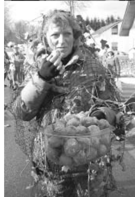
Auf dem Karnevalszug gab es jede Menge zu sehen

merksam. Den einen oder anderen konnte man am Straßenrand begrüßen. Der Rest der Lyra ging als Urwald. Hierzu wurden Netze